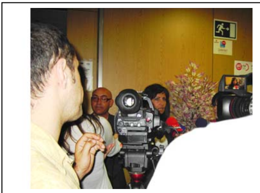
La Alcaldesa Doña Carmen Oliver atendiendo a los medios