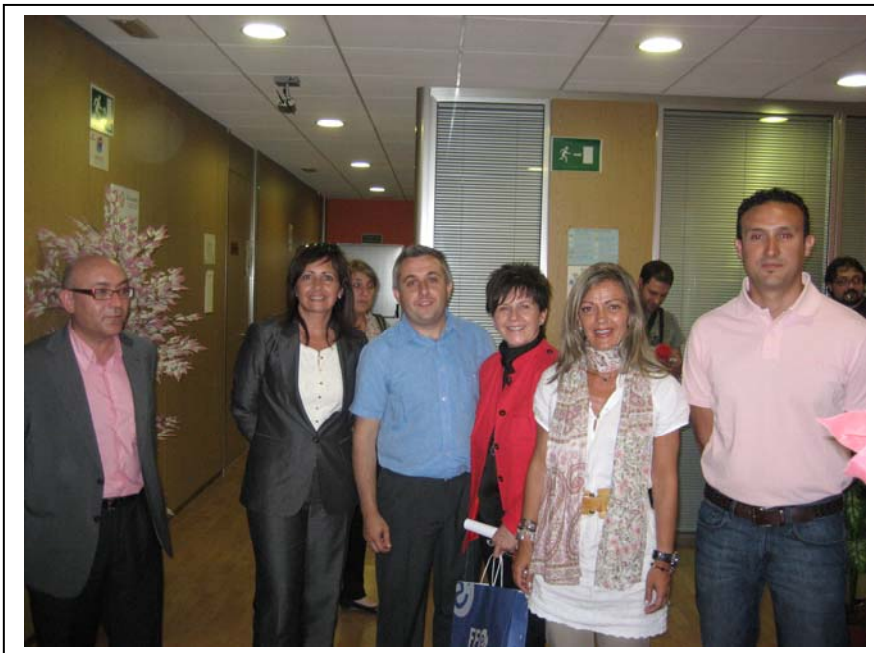
La Alcaldesa posa junto a miembros de la Federación de Servicios Públicos de UGT y parte del personal de la empresa